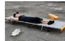
Votre lit de camp est prêt