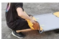
Rouler et attacher les deux côtés de la tente