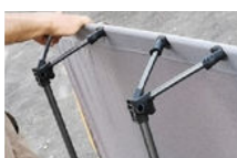
Clipser les bipieds sur les barres transversales