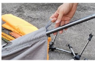
Glisser les barres dans les tunnels de chaque côté de la toile du lit