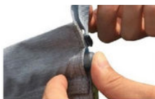
Enfoncer complètement les barres