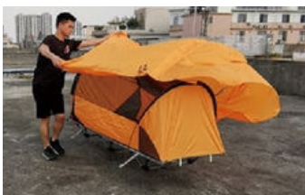
Positionner la toile sur la tente dans le bon sens (tente asymétrique)