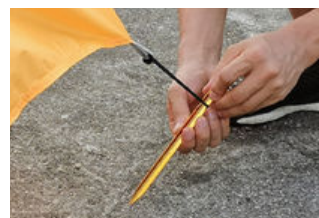
Fixer votre toile à l'aide des sardines si le sol le permet