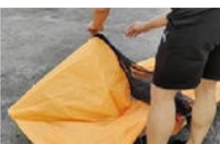
Retirer le double toit Dézipper la tente du lit