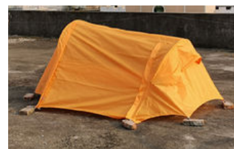
Sinon utiliser du poids pour lester