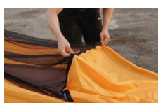
Monter 2 les arceaux en les glissant dans les tunnels correspondants