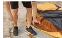
Retirer les arceaux