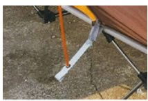
fixer les extrémités dans les oeillets des sangles du lit