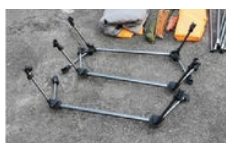
Monter les bipieds du lit